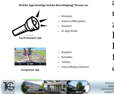
Abb. 1: Beispielseite